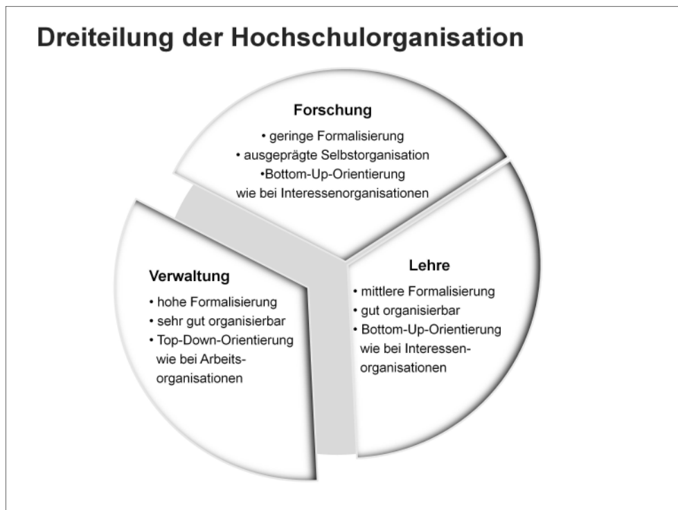
Abbildung 1: Dreiteilung der Hochschulorganisation

So sind mit Forschung, Lehre und Verwaltung drei Organisationsbereiche unter einem Dach vereint, deren Funktionslogiken sich deutlich voneinander unterscheiden: