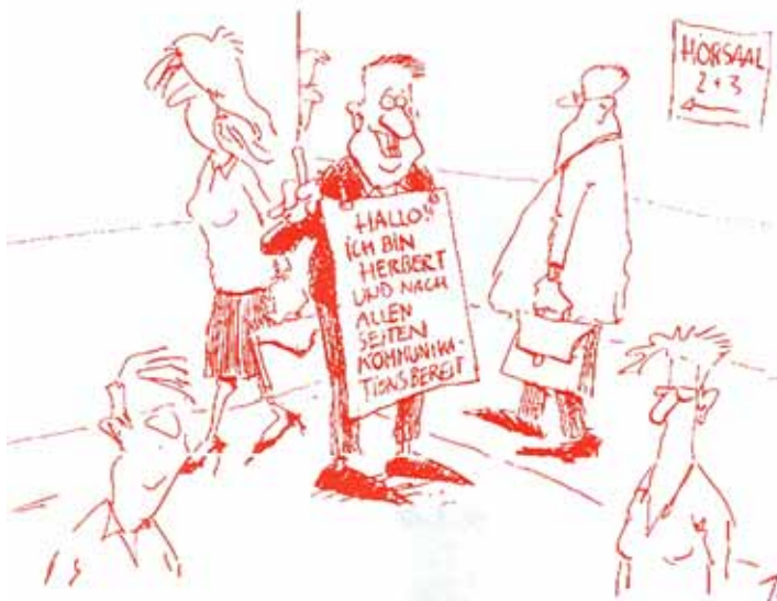
Problembewußtsein und Handlungsbereitschaft – Es gibt Ansätze!

Eine Arbeitsgruppe aus Studierenden der Universitäten Dortmund, Münster, Osnabrück und Paderborn hat eine Angebotspalette entwickelt, aus der zur Zeit erste Maßnahmen umgesetzt werden. Die Möglichkeiten reichen von Online-Diskussionen mit Prominenten, themenzentrierten Diskussionen zu aktuellen Themen der Hochschulpolitik, über ein „Stimmungsbarometer“ (Wie hat Ihnen das Mensaessen heute geschmeckt? oder Wie gut sind Sie mit Ihrer Wohnsituation zufrieden?) und Hyperlinks zu Informationsknotenpunkten im Internet bis zu Praktikumsbörsen von Studierenden für Studierende. Erweiterungen und Ideen sind jederzeit willkommen. Der CHEroom wird mit der CHE Homepage verknüpft sein, in der nach wie vor Informationen über das CHE abgerufen werden können: www.che.de !