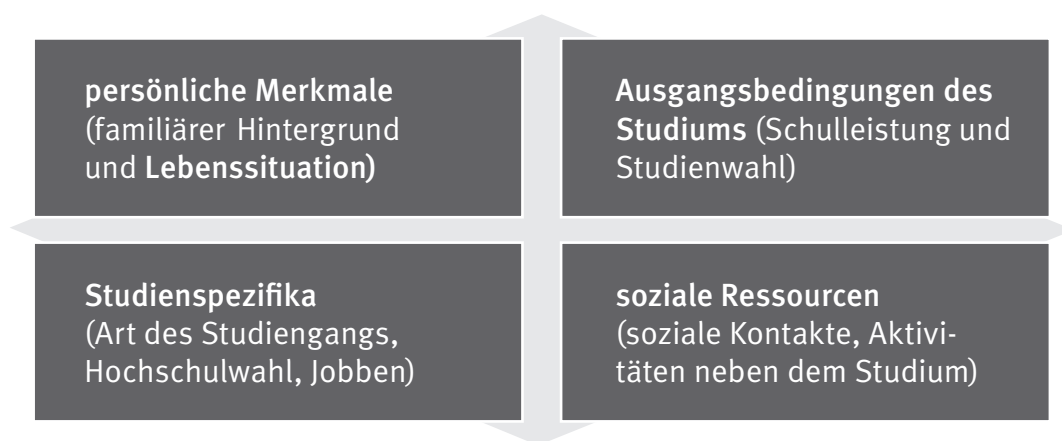
Abbildung 2: Die vier Dimensionen des statistischen Modells

Ausgangspunkt der Regressionsanalyse sind all die Variablen (zusammengefasst zu vier Dimensionen, vgl. Abbildung 1), bei denen die Verteilung auf das obere, mittlere und untere Drittel des QUEST-Werts signifikant, d.h. überzufällig ist. 5 Über eine multivariate Regression wurden dann schrittweise die zentralen Variablen identifiziert, die die Verteilung in das untere oder obere Drittel begünstigen: Dies sind die Aspekte, die hohes Erklärungspotential dafür besitzen, ob eine gute (Förderfaktoren) oder eine weniger gute (Risikofaktoren) Adaptionssituation vorliegt.