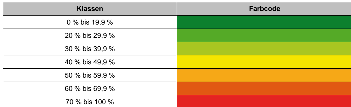
Tabelle 4: Klasseneinteilung der NC-Quoten und Farbcodierung

Die Einfärbungen der Tabellen und Grafiken erfolgt entsprechend der in nachfolgenden Tabelle dargestellten Farbcodierung für sieben verschiedene Klassen.